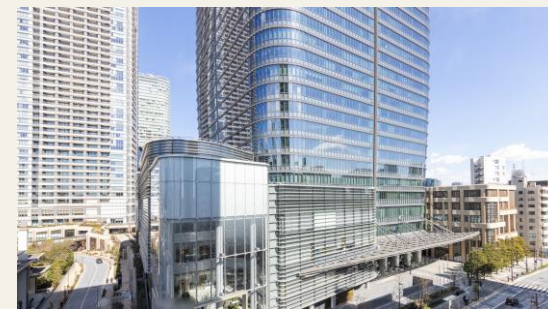
※リビングからの眺望