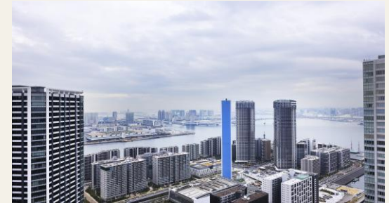
※リビングからの眺望