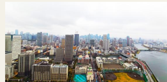
※リビングからの眺望