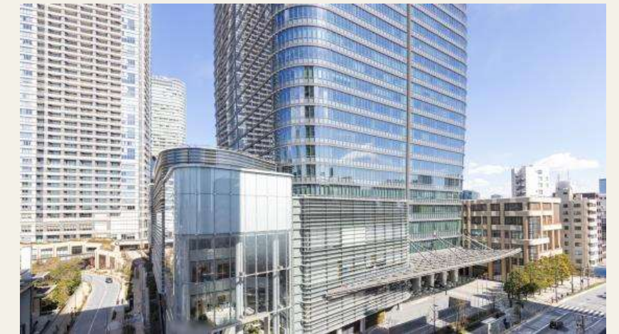
※リビングからの眺望