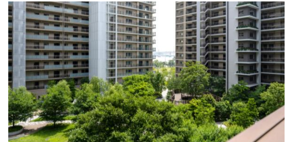
※バルコニーからの眺望(中庭ビューですがレインボーブリッジが望めます)